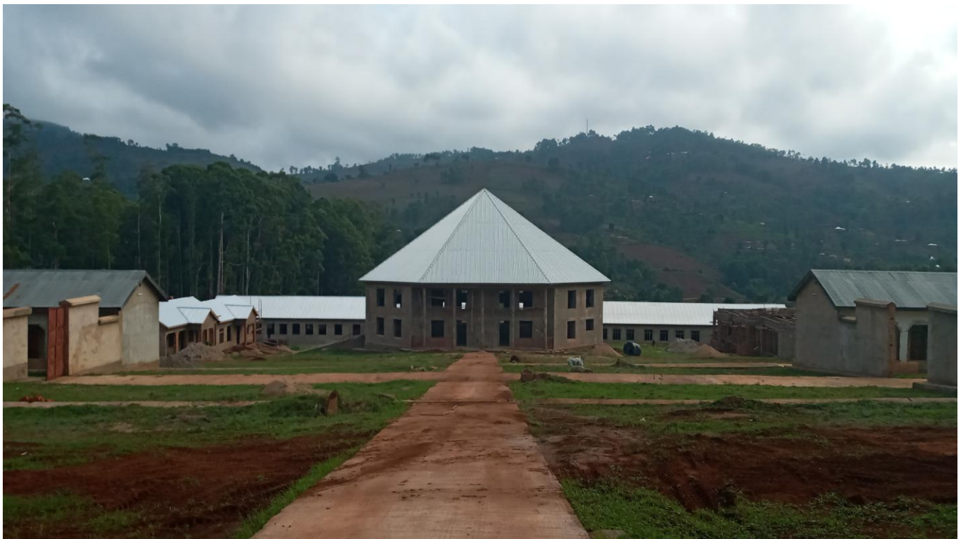
Liteambo Krankenpflege- und Laborschule