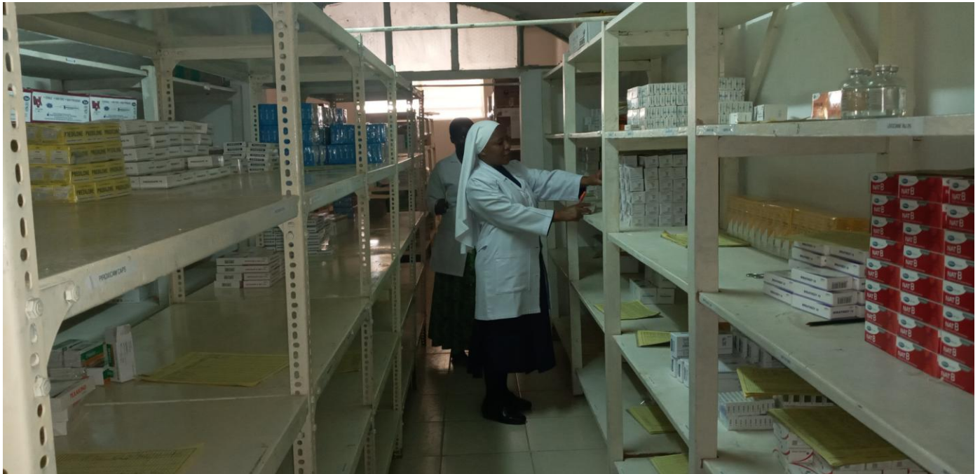
Litembo Hospital Pharmacy

Im Juli fand für alle Mitarbeiter/innen des Hospitals eine Schulung statt. Die Themen waren: Covid 19, Arbeitsrecht und weitere Verbesserung der Qualitätsentwicklung.