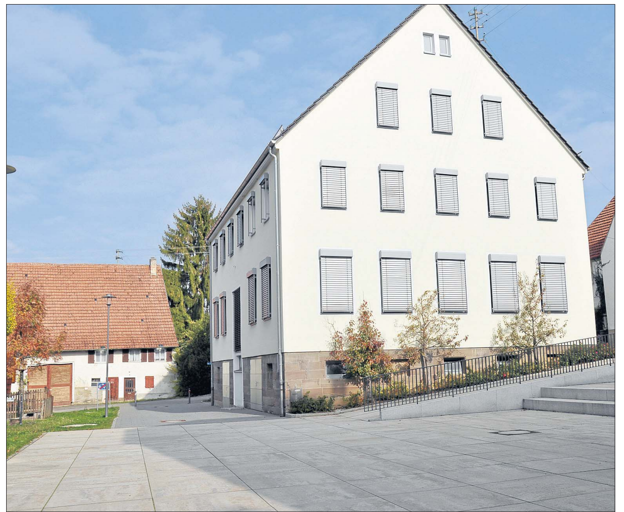
Das Isinger Schulhaus wirkt ohne die Kinder verlassen. Bald schon soll aber wieder Leben im Haus herrschen. Der Ortschaftsrat hat jetzt ein Belegungskonzept erarbeitet, das dem Gemeinderat vorgelegt wird.

Im Obergeschoss soll der neu gegründete Verein, die Molkekäbälle, eine Heimat bekommen. Der EDV-Raum könnte für das Kinderlernprogramm genutzt werden und der Werkraum soll auch weiter als solcher für kreative Angebote genutzt werden, denn die Werkbänke bleiben da. Lehmann nannte hier das Stichwort Reparaturwerkstatt. Denkbar ist zudem, dass der VHS ein Schu-